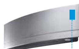
Daikin Emura wordt standaard* geleverd met een ingebouwde Wifi adapter

Identificeer de ruimtes in uw huis om gemakkelijk de juiste unit te bedienen