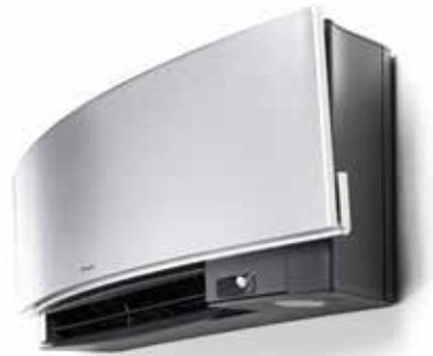
Fluisterstil: slechts 19 dB(A)

De intelligente 2-zonebewegingssensor regelt het comfort op twee manieren. Wanneer er langer dan 20 minuten niemand in de ruimte is, wordt de ingestelde temperatuur aangepast om energie te besparen. Zodra iemand de ruimte binnenkomt, keert het systeem automatisch terug naar de oorspronkelijke temperatuur. Deze sensor zorgt er ook voor dat de luchtstroom wordt weggeleid van mensen in de ruimte zodat tocht wordt vermeden.